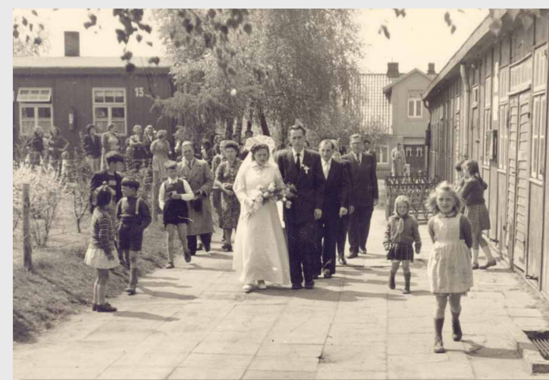
Eine Hochzeit im DP-Camp Falkenberg in Hamburg-Neugraben, Sommer 1950

Aus: Patrick Wagner: Displaced Persons in Hamburg. Stationen einer halbherzigen Integration 1945 bis 1958, Hamburg 1997, S. 58